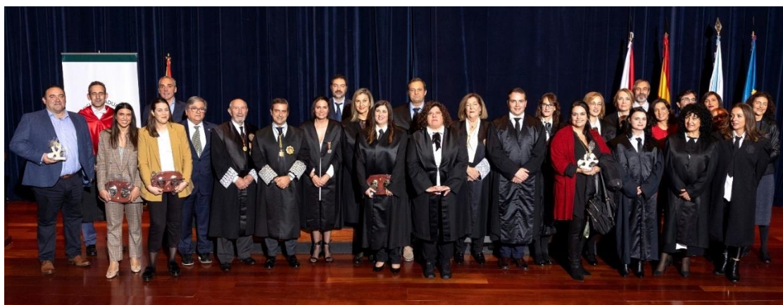
Distinguidos e distinguidas, compoñentes mesa institucional e Xunta de Goberno de COGRASOP