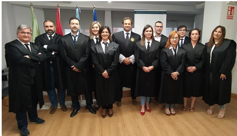
Presidente e membros da Xunta de Goberno

En reunión de Xunta de Goberno celebrada o día 26 de maio de 2022, o Presidente tomou xuramento/promesa aos vocais electos, así como a designación dos seus cargos.