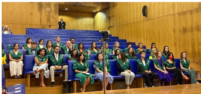
Graduados e Gradudas